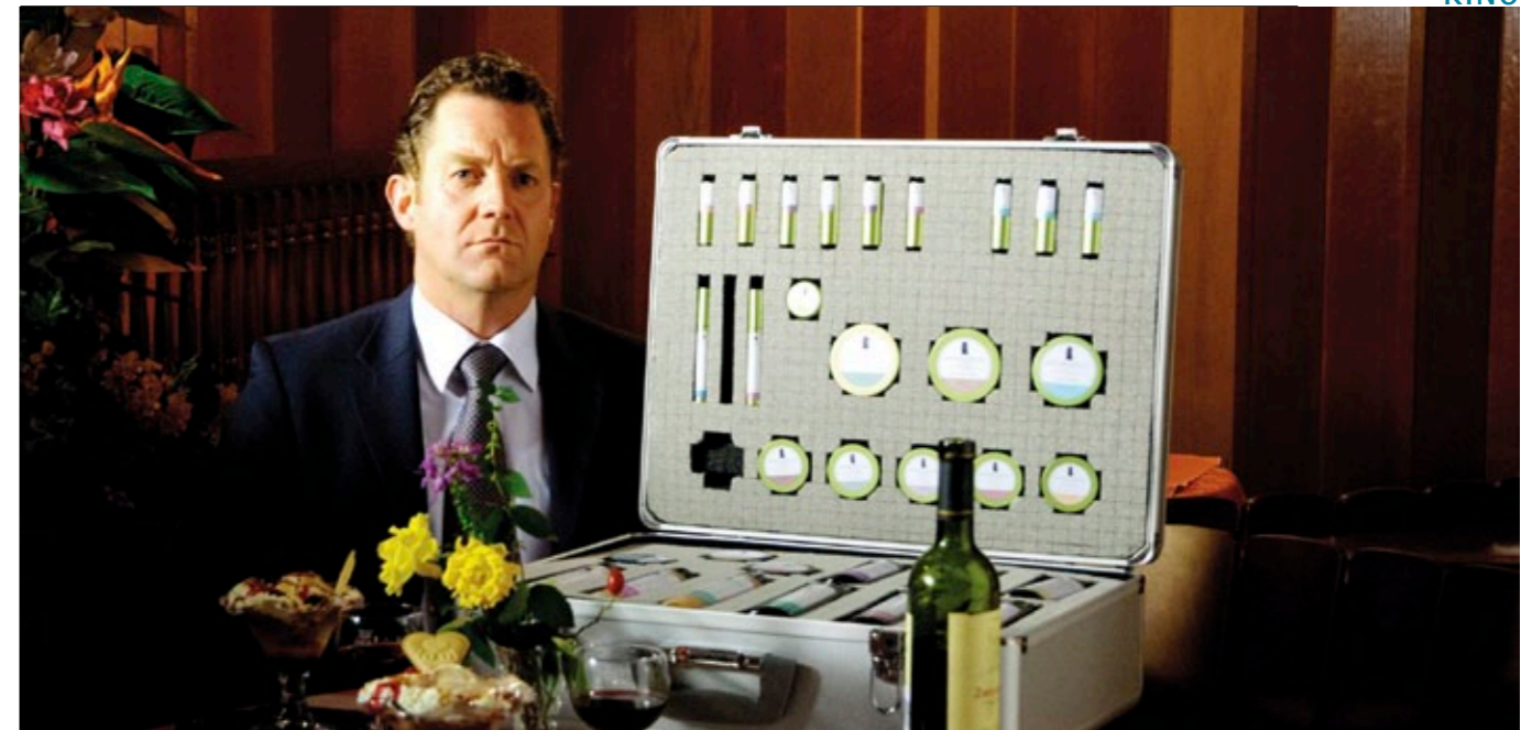
Christiane ist von Pit enttäuscht. Einsam bleibt er mit seinem Kosmetikkoffer zurück.

i Brisa Roché – All right now steht seit dem 17. September 2010 in den Regalen. Label: Discograph